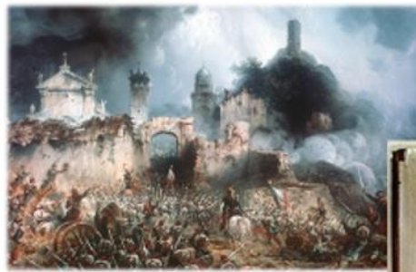
Bitka kod Solferina 24. lipnja 1859.