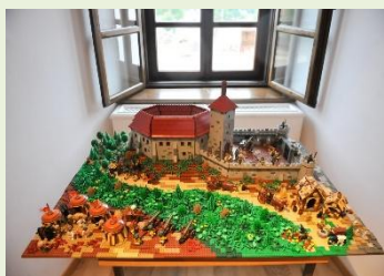
Muzej grada Đurđevca