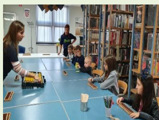
Gradska knjižnica Đurđevac