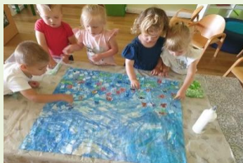
Dječji vrtić „Maslačak“ Đurđevac