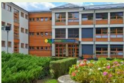
Osnovna škola Đurđevac