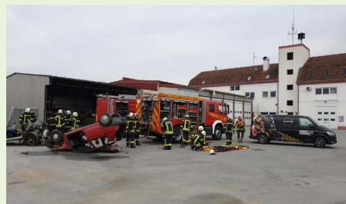
Javna vatrogasna postrojba Đurđevac

Korisnici lokalnih proračuna su ustanove koje je osnovala lokalna jedinica te koje se financiraju iz lokalnog proračuna, a djelomično iz prihoda od vlastite djelatnosti.