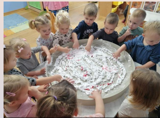
Dječji vrtić „Maslačak” Đurđevac