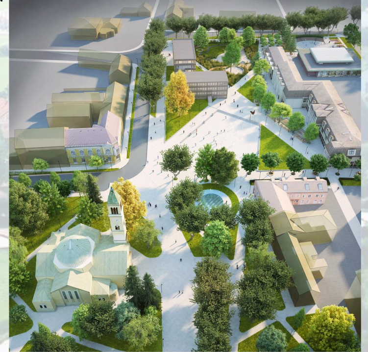
Pogled prema centru iz ptičje perspektive.