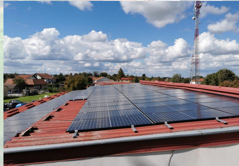
Solarni paneli na Javnoj vatrogasnoj postrojbji Đurđevac