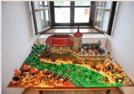
Muzej grada Đurđevca