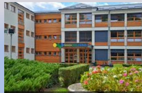
Osnovna škola Đurđevac

Korisnici lokalnih proračuna su ustanove koje je osnovala lokalna jedinica te koje se financiraju iz lokalnog proračuna, a djelomično iz prihoda od vlastite djelatnosti. Njihovi proračunski prihodi i rashodi su sastavni dio proračuna grada Đurđevca.