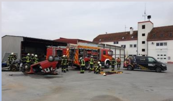
Javna vatrogasna postrojba Đurđevca

Korisnici lokalnih proračuna su ustanove koje je osnovala lokalna jedinica te koje se financiraju iz lokalnog proračuna, a djelomično iz prihoda od vlastite djelatnosti. Njihovi proračunski prihodi i rashodi su sastavni dio proračuna grada Đurđevca.