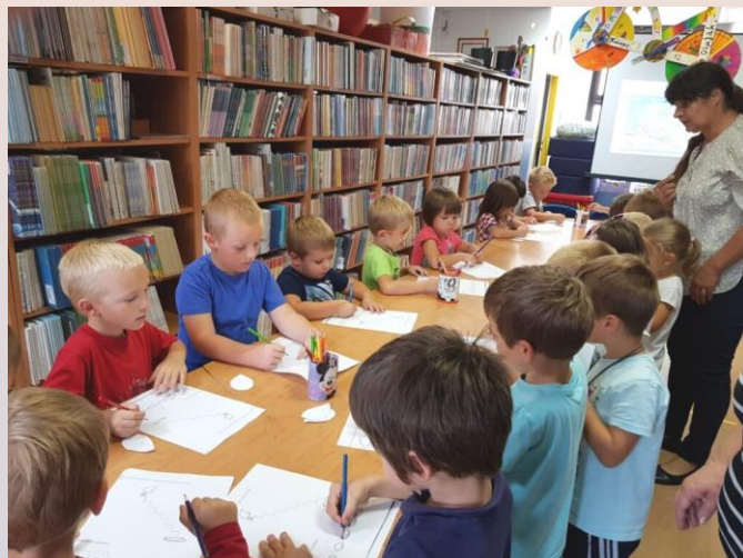
Gradska knjižnica Đurđevac