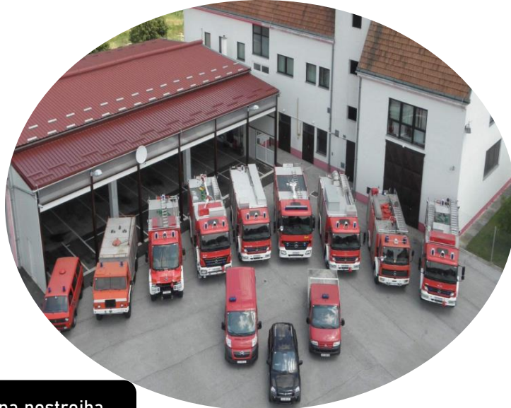
Javna vatrogasna postrojba Đurđevca