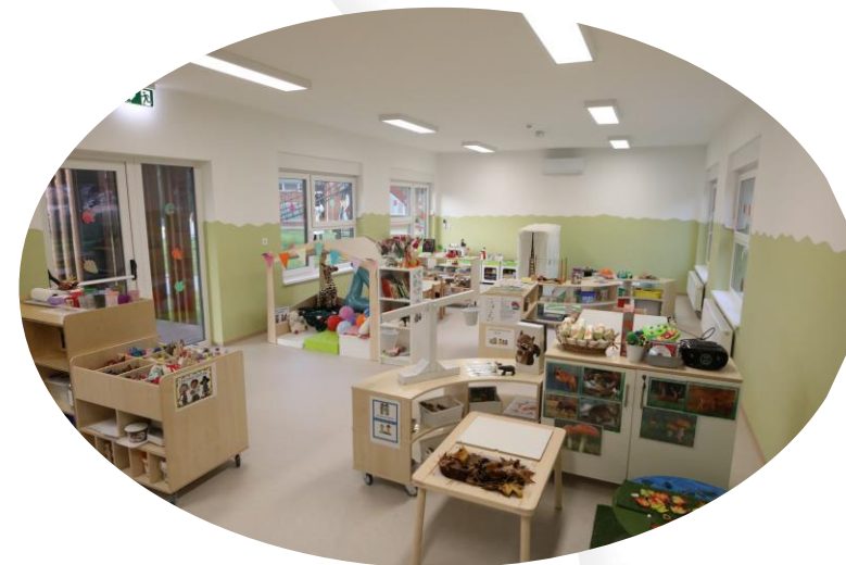
Dječji vrtić „Maslačak“ Đurđevac