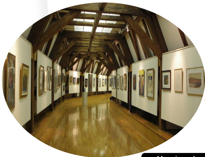
Muzej grada Đurđevca